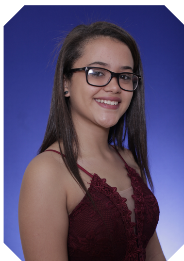
Maria Helena Sá e Brito EMEFM Maestro M. Pietrobon