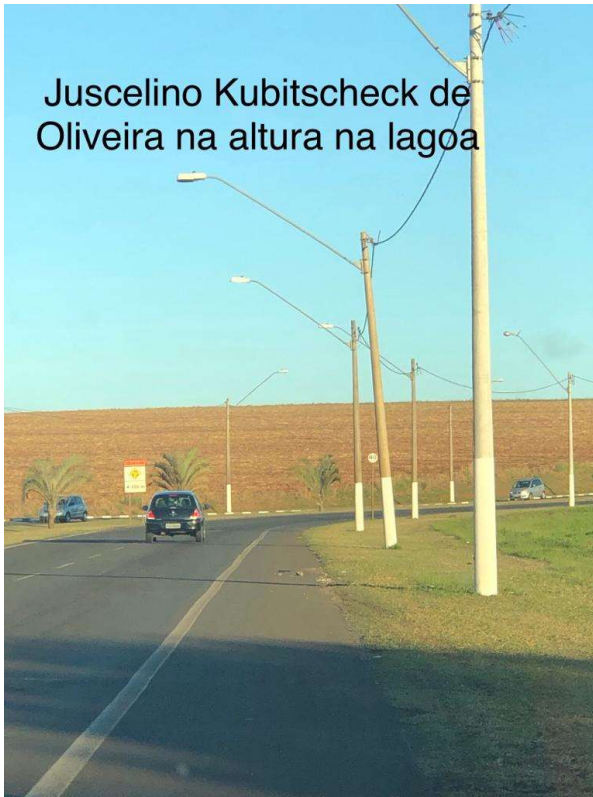
Juscelino Kubitschek de Oliveira na altura na lagoa