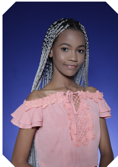
Eloá C. de Oliveira e Silva E.E. Residencial São José