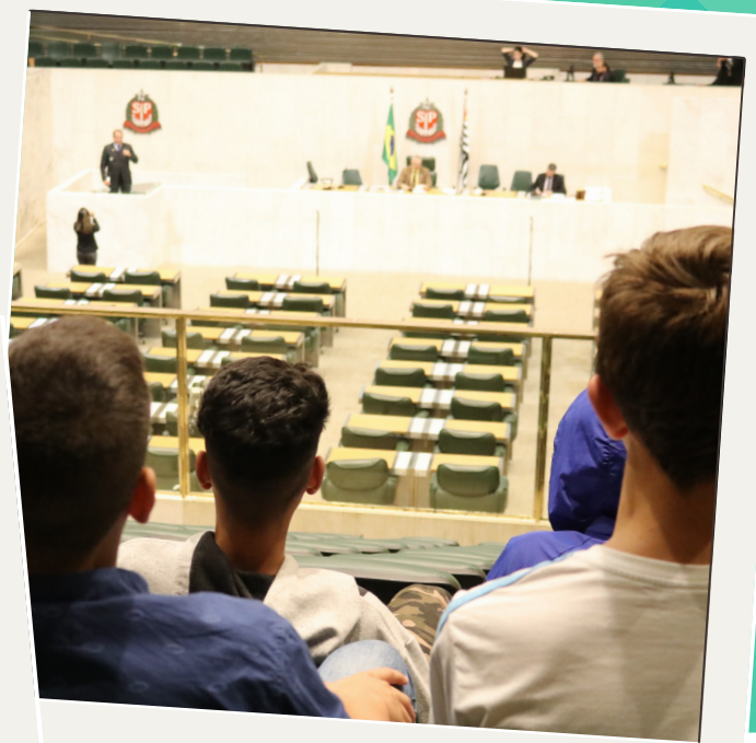
#Agosto Visita à Assembleia Legislativa