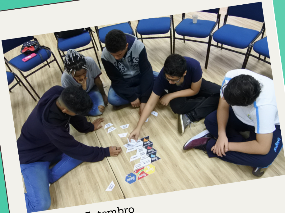
#Junho e #Setembro Oficinas