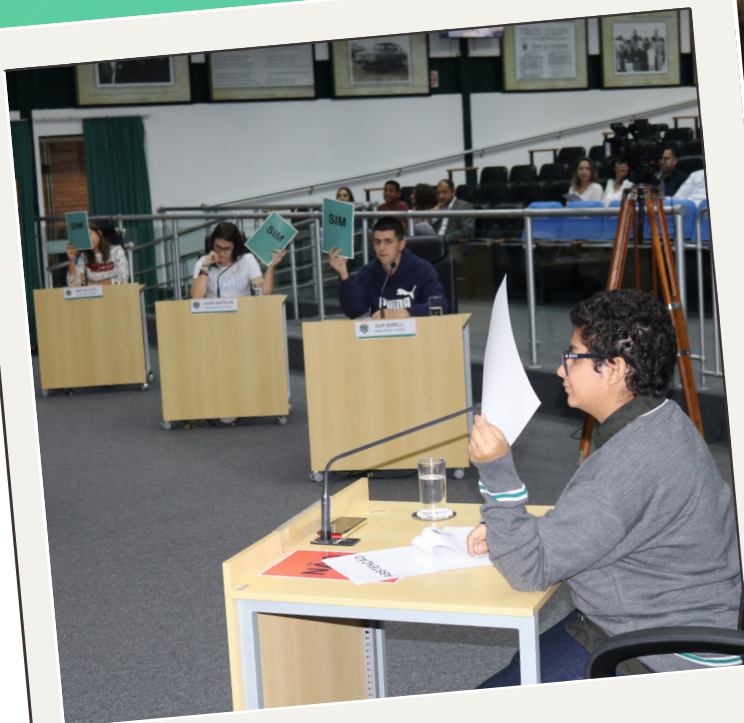
#Setembro e #Outubro Sessões e votações de propostas